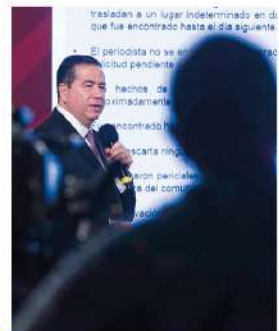
Pág. 2 Nacional.

• ASESINATOS, VINCULADOS AL CRIMEN ORGANIZADO • Muertes podrían no estar ligadas a su actividad periodística, aseguran autoridades