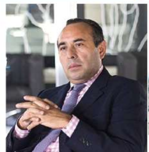
PÁG. 8 XALAPA.