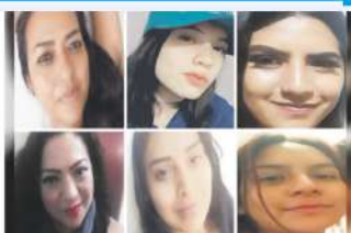
Pág. 2 Nacional.