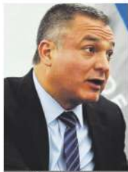
Pág. 2 Nacional.

> Lo abandonaron los panistas involucrados, reprocha su defensa