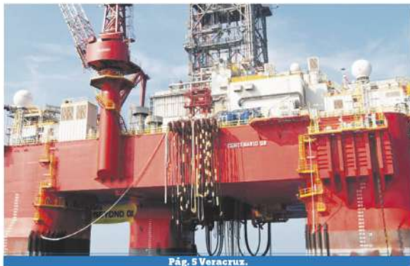
Pág. 5 Veracruz.

> ANUNCIAN italianos descubrimiento en costas del Sureste de México > PRIMERAS estimaciones calculan 200 millones de barriles