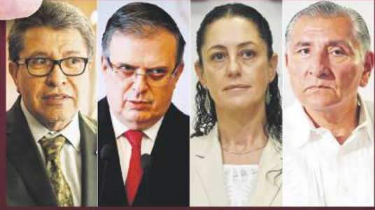
Pág. 2 Nacional.

> SERÁ la encuesta la que decida al candidato: AMLO > 'ASUMO la responsabilidad histórica de la sucesión presidencial'