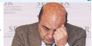
Pág. 2 Nacional.

> Va en deterioro salud del ex titular de PGR, dice su abogado