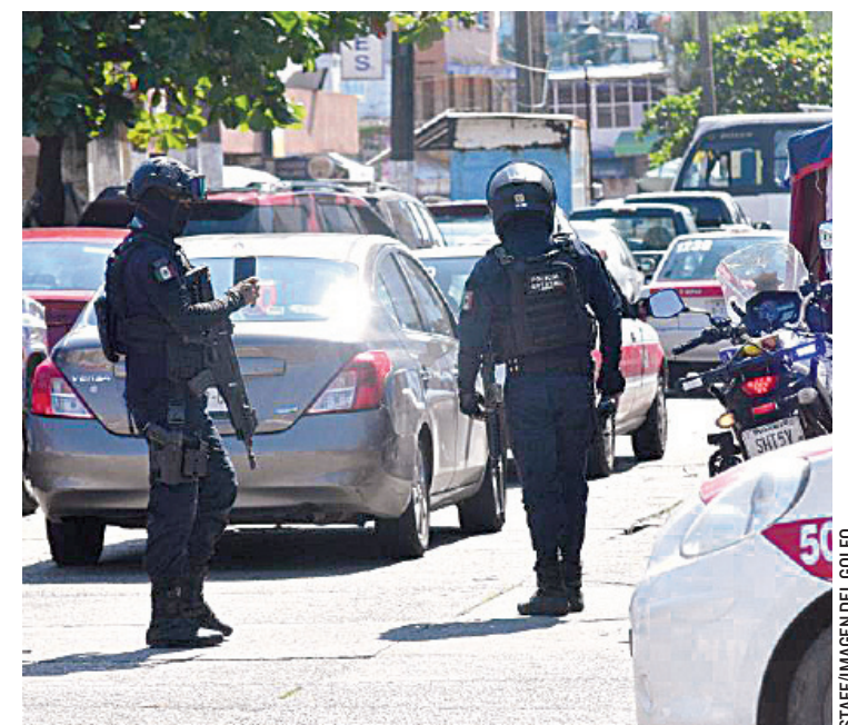
LA POLICÍA MUNICIPAL continúa con sus recorridos de proximidad social.

dió que estas asesorías brindadas sobre el engaño telefónico no son propiamente solicita-