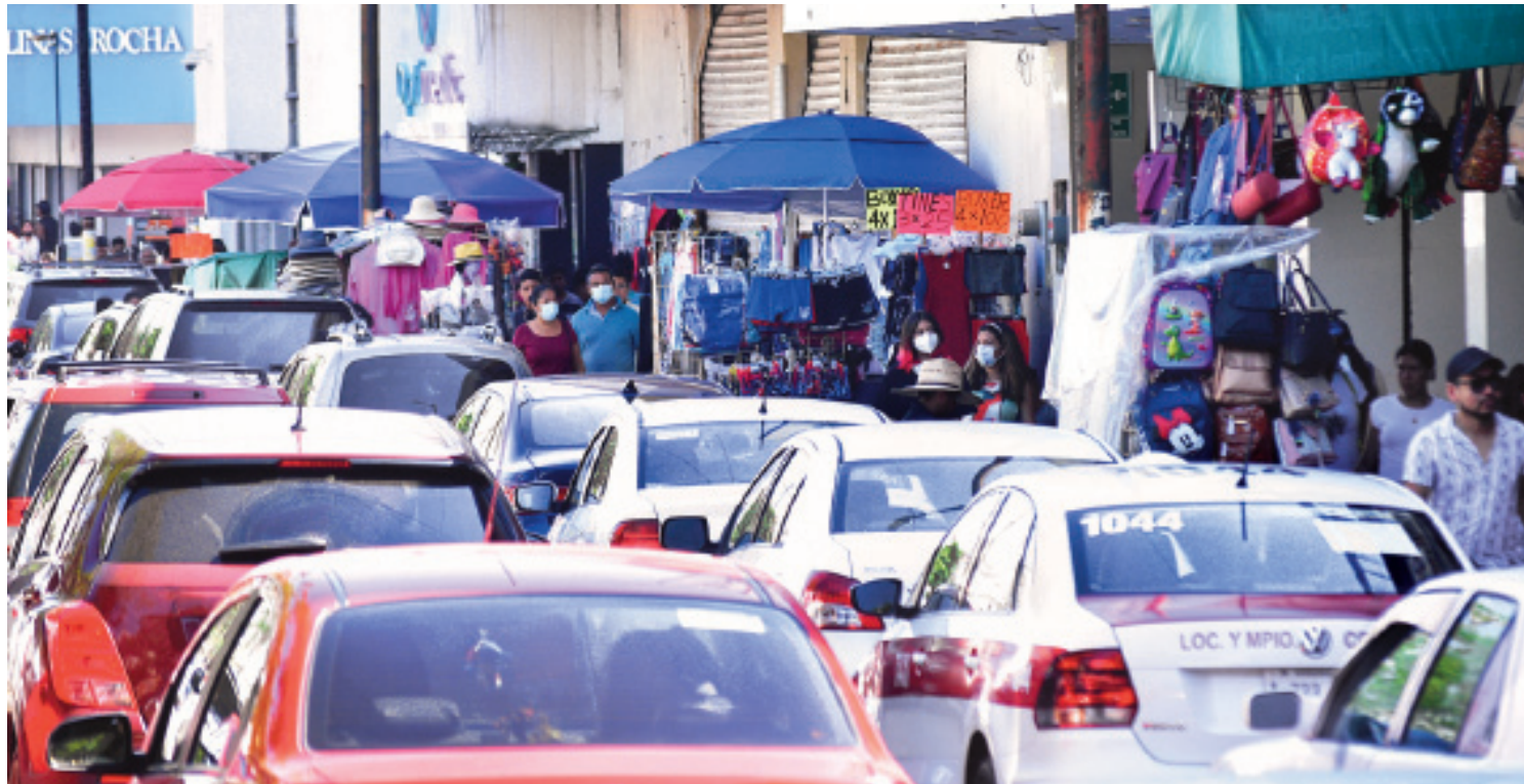
LOS AMBULANTES SIEMPRE han sido un problema en Coatzacoalcos, y se necesita un plan que lo solucione al fin.