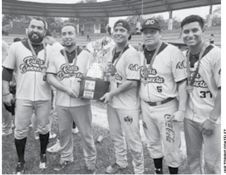
JUGADORES DEL EQUIPO Ruta Correcta Acayucan posaron con el trofeo de campeón de la Liga Sureste de Beisbol.

En el tercero nuevamente Novatos Jicamereros de Oluta salió avante 9-2, en el cuarto encuentro, Ruta Correcta Acayucan se impuso 5-4, en el quinto juego, nuevamente Ruta Correcta Acayucan superó a Novatos Jicamereros de Oluta 4-2 y el pasado fin de semana Acayucan volvió a salir con banderas desplegadas con pizarra de 5-3, al término de las acciones la directiva llevó a cabo la ceremonia de premiación.