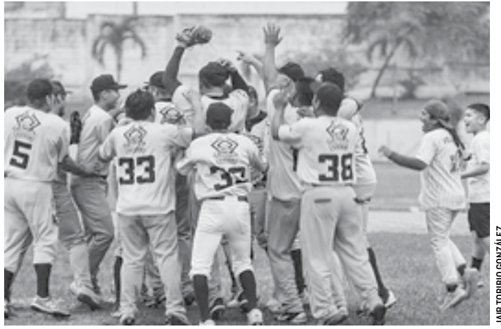
DE ESTA MANERA festejaron la conquista del título los jugadores del equipo Ruta Correcta Acayucan.

Esta llave se cerrará el 1 de mayo en el estadio BBVA.