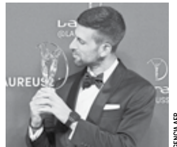
NOVAK DJOKOVIC fue elegido por delante del campeón del mundo de F1, Max Verstappen.

Y la gimnasta estadounidense Simone Biles recibió, a distancia, el trofeo al mejor regreso del año, mientras que el tenista español Rafa Nadal fue recompensado por su fundación y sus proyectos educativos en diferentes lugares del mundo.