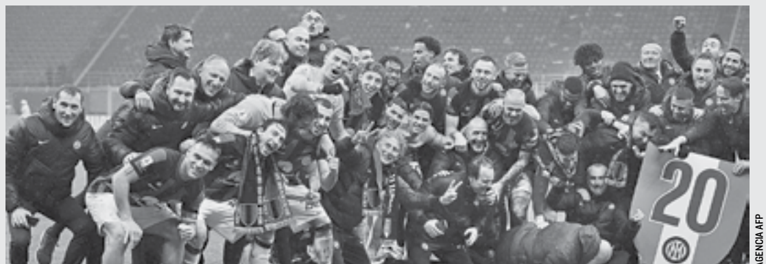
EL INTER DE MILÁN se convirtió en el segundo equipo de la historia en conquistar en 20 ocasiones el campeonato de Italia.

El tramo final del partido se vio salpicado por varios