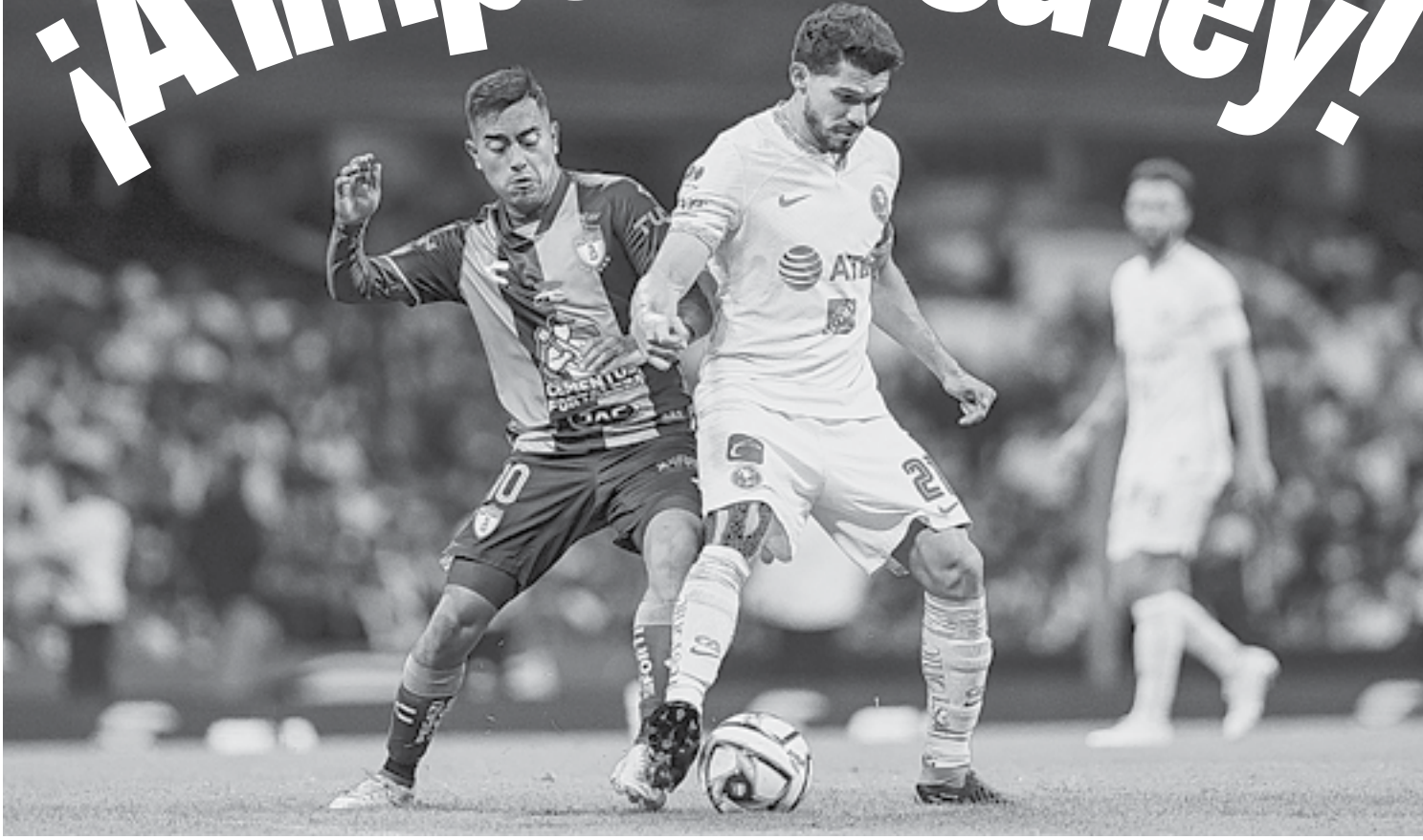
AMÉRICA BUSCARÁ tomar ventaja como local frente a Pachuca.

Al abrir las semifinales de la Copa de Campeones