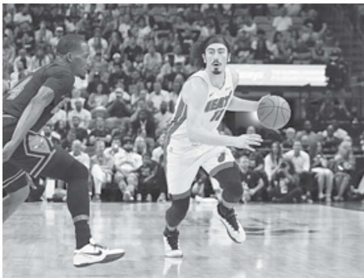
JAIME JAQUEZ JR. no fue considerado en el top 3.

Para el mejor defensivo del año, la terna está integrada por Bam Adebayo (Heat), Rudy Gobert (Timberwolves) y el novato sensación Victor Wembanyama (Spurs). De nueva cuenta dos jugadores internacionales, ambos franceses, y los tres se desempeñan en la posición de pivot. Cabe destacar que Gobert ya ganó dicha distinción en tres ocasiones,