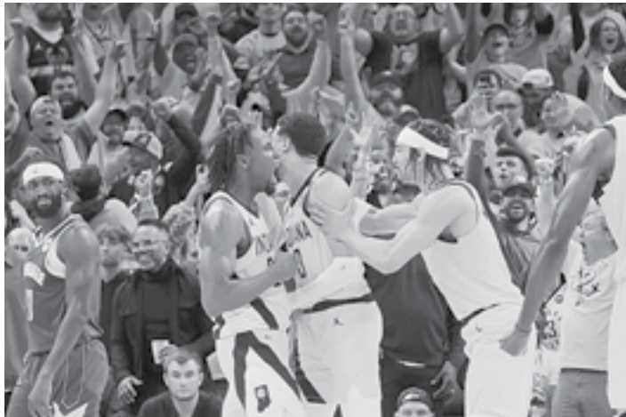
JUGADORES DE LOS PACERS de Indiana así celebraron el triunfo sobre los Bucks de Milwaukee.

Dallas vencieron 101-90 a los LA Clippers para adelantarse 2-1 en la serie.