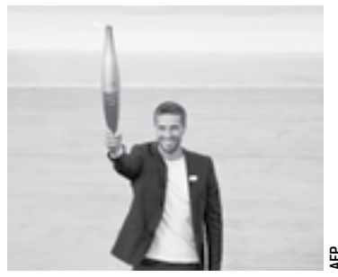
TONY ESTANGUET, dirigente del COJO, posa sonriente con la llama de los Juegos Olímpicos.

Hora: 21:00 Estadio: Jalisco Transmisión: TUDN y TV Azteca