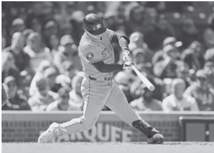
HOUSTON ENFRENTA este sábado a Colorado en partido de temporada regular.