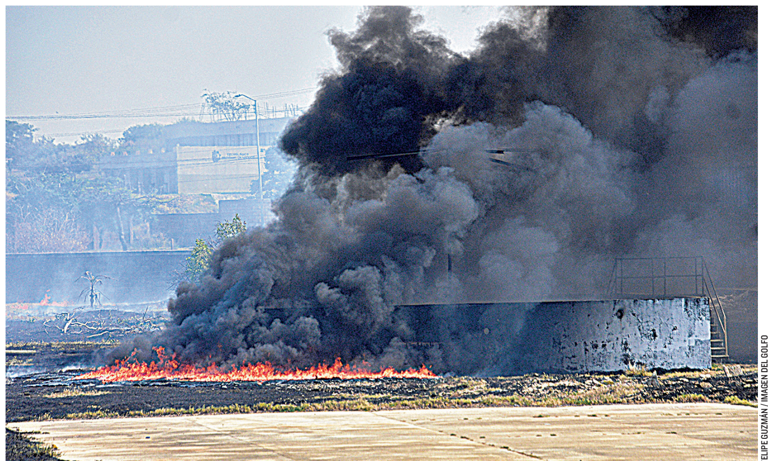
EXTENSA ZONA DE PASTIZALES fue consumida por el fuego en terrenos cercanos a las bodegas de empresa de lácteos.

Por si fuera poco todo lo anterior, los bomberos acudieron a Ciudad Olmeca donde de nueva cuenta se generó otro incendio, pero cuando llegaron, los vecinos lograron controlarlo, aún con la carencia de agua.