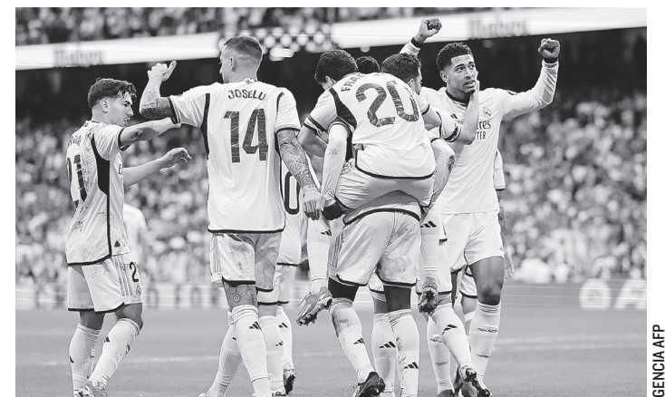
REAL MADRID SE ADUEÑÓ del título de la temporada, gracias a su triunfo y derrota del Barcelona.

Por su dedicación y entrega, no se duda que la porteña siga dando más satisfacciones al tenis nacional.