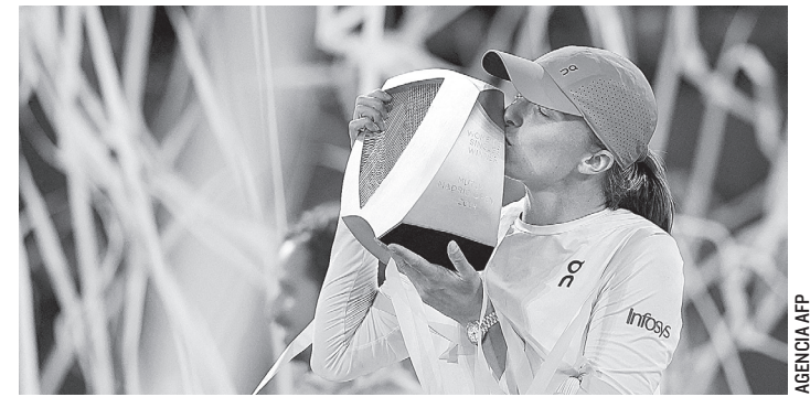
LA POLACA IGA SWIATEK celebra su título.

"Es la final más intensa y loca que he jugado", admitió Swiatek, antes de añadir: "Estoy muy feliz y orgullosa porque cuando tienes partidos así que tienes que pelear de principio a fin, sabe incluso mejor".