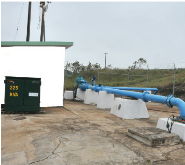
DESDE EL AÑO PASADO LA CMAS Coatzacoalcos, inició con la rehabilitación de los 28 pozos que se encuentran en Calzadas y Canticas.

"Nosotros estamos perdiendo aproximadamente de 200 a 250 litros por segundo del Yurivía, lo que vamos a recuperar con esta activación de pozos son aproximada-