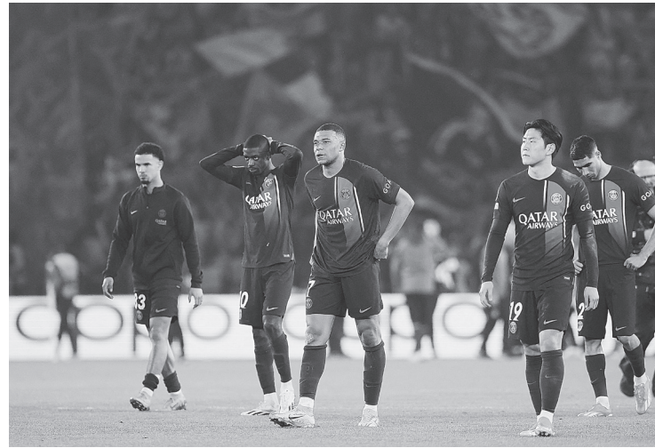
PARÍS SAINT GERMAIN no pudo en casa frente al Borussia Dortmund que se clasificó a la final.

"Vamos a celebrarlo, es algo grande haber podido clasificarnos a la final, pero queremos lograr algo más grande aún y aún queda un largo