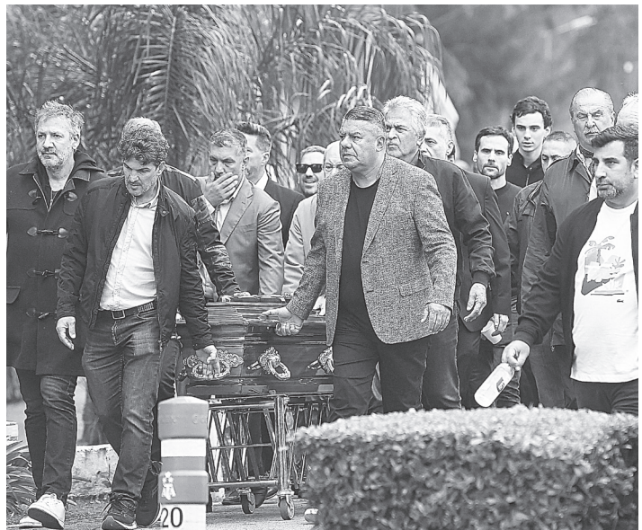
PERSONALIDADES DEL FUTBOL argentino despidieron al técnico César Luis Menotti.